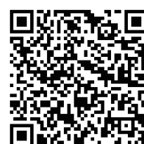
動画が視聴できます