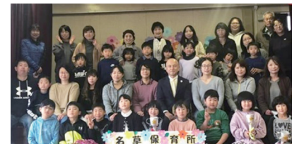
名草保育所閉所に伴う「ありがとう祭」

● 3月12日(金) 新会派「織姫クラブ」幹事長及び議会運営委員に就任 市議会議員としての経験値を上げるために先輩議員の計らいもあり、会派の幹事長と議会運営委員を務めることになりました。