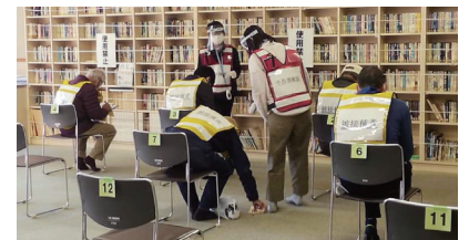
コロナワクチン接種のシュミレーション

● 2月23日(火) コロナワクチン接種のシュミレーション ワクチンを効率よく打つために、市民の方々と本番さながらに行い今後に活かしていきます。