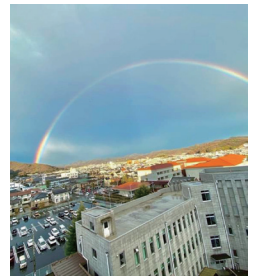
綺麗な虹でしたね！

● 1月28日(木) 会派要(旧万和クラブ)が叶いました 自宅療養者に対する生活支援に続き、高齢者・障害者施設の通所施設職員に対する抗原検査費助成も事業化されました。