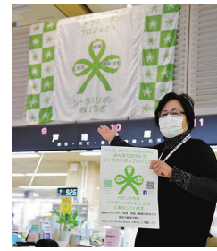
シトラスリボンINとちぎ

● 1月12日(火)～22日(金) シトラスリボンINとちぎ シトラスリボンINとちぎ 新型コロナウイルスに感染された方やエッセンシャルワーカーに対する誹謗中傷をなくそうと訴える運動『シトラスリボンプロジェクト』が、巨大フラッグを栃木県内を廻る取り組みを行い、足利市は、足利市役所の一階市民課頭上に掲示しました。