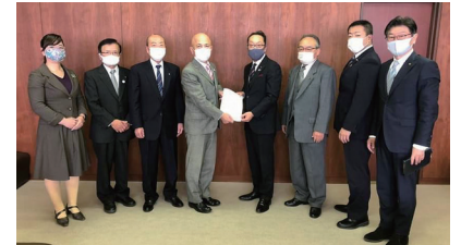
会派要(旧万和クラブ)が叶いました

● 2月21日(日) 西宮町林野火災 3月1日 鎮圧、15日 鎮火 ・ 出火原因 たばこに起因するものと推定 ・ 林野被害の面積 167ヘクタール (県環境森林部森林整備課調べ) ・ 森林被害額 3千2百万円 ・ ふるさと足利応援寄附金(3月30日現在) 2,748件 47,763,387円