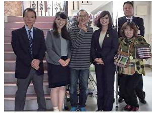
たつの市障がい者支援を視察