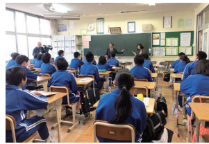
中学校出前講座「毛野中学校」