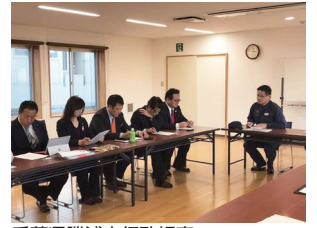
千葉県勝浦市行政視察