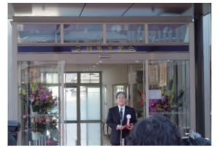
足利市医師会竣工式・内覧会