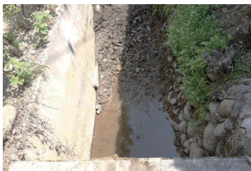
月谷町 土砂の除去作業