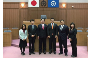
千葉県鴨川市行政視察