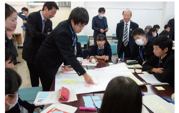
「議会報告会」副委員長としての活動