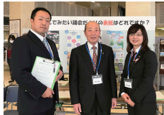
「広報委員会」委員長としての活動

まずは、市議会議員のことを知ってもらおうと事前配布した「市議会のしくみ」を1から資料作成したり、意見交換会をワークショップ形式で行ったりしましたので、その進行や当日の司会等など、すべてが1からの準備でしたので大変でした。しかし、実施中見受けられた高校生や参加議員のキラキラとした笑顔を見て、疲れも癒されました。