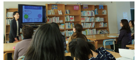
北郷小をお借りして実施した図書館ボランティア研修会の様子

校図書館、読み聞かせ等のボランティアのみなさんが連携できる仕組みを充実させていきたいです。