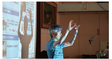
食物アレルギー講座の様子

保護者が楽しんで子育てをし、子ども達が健やかに成長することを願って活動しています。主に子育て情報誌「いっしょに子育てガイド」作成しています。私は、主に食物アレルギーの子を持つ保護者支援を担当し、小中学校にて食物アレルギー講座を実施したり、2ヶ月に1度のペースで食物アレルギー座談会をしゃんしゃん広場(しらゆり幼稚園内)で開催したりしています。