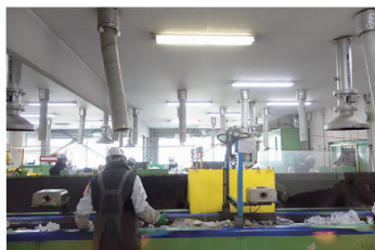
流山市クリーンセンター