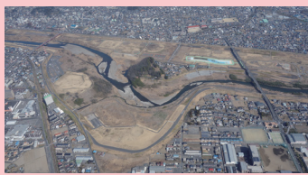
予算要望のサッカー場整備予定地朝倉福富緑地

サッカーの競技人口に比べ、大幅にサッカー場の整備が遅れている足利市。昨年度に引き続き要望し、「候補地等の検討をしております」との回答から「対応します」になり、朝倉福富緑地にサッカーにも利用できる多目的広場の整備(2億500万円)が始まります。