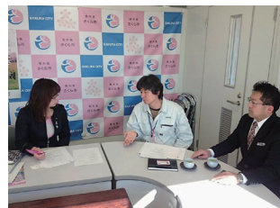
さくら市にて防災士について研修のようす