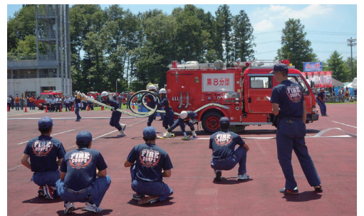
平成30年度は、第9分団が出場します!