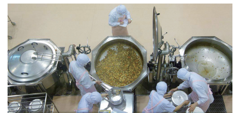
「いりどり」を調理中

昨年の調理場視察(施設見学)に続いて、今回は、見学用通路から釜を使う調理場を見学し、釜を開けると蒸気で2階のガラス窓が曇ってしまいました。出来上がると栄養士が、味見・温度調査(85度で3分)・検査を取り出した後に、食缶へ。その後各学校へ届けられます。