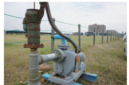
競馬場跡地芝生広場にある「手押しポンプ式井戸」