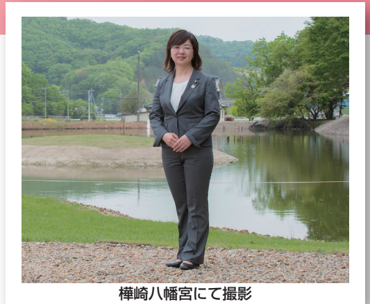
榊崎八幡宮にて撮影