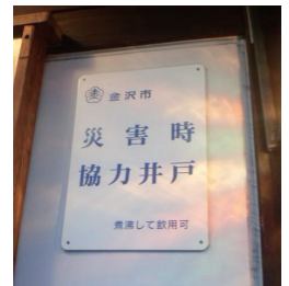
金沢市で見つけた「災害時協力井戸」の看板