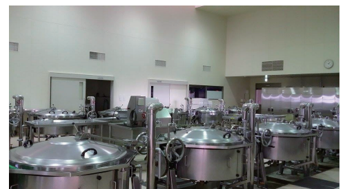
足利市学校給食共同調理場