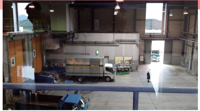
みかもクリーンセンター

食物アレルギーに長年携わってきている私にとっては栃木市が作成した「アクションカード」には興味が