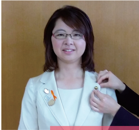
2015年 1期目 初登庁